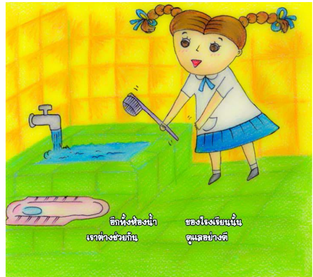
ตัวอย่างนิทานคุณธรรม เรื่อง “เด็กดีศรีจรรยา” ผลงานของนักเรียนที่ช่วยกันคิดและจัดทำเป็นรูปเล่ม